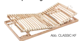
Abb. CLASSIC KF

Bestens kombinierbar mit Produktlinie CLASSIC