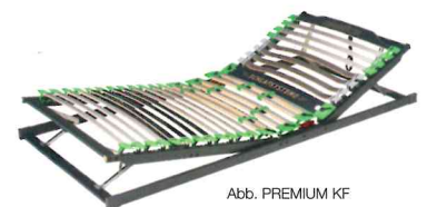
Abb. PREMIUM KF

Bestens kombinierbar mit Produktlinie PREMIUM IM SET MIT PREISVORTEIL!