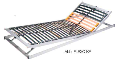
Abb. FLEXXO KF

Bestens kombinierbar mit Produktlinie FLEXXO