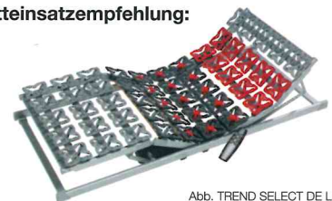
Abb. TREND SELECT DE LUXE

Bestens kombinierbar mit Produktlinie TREND SELECT ODER PREMIUM